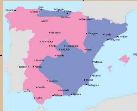
Mapa d'Espanya al 1937

Aquest llibre del 1937, va ser creat en una època difícil per Catalunya, ja que 6 anys abans, al 1931, Espanya canvia el model d'estat, de ser una monarquia a ser una república, però veien que el país no avançava com pensaven, el 17 de juliol del 1936, els generals Emilio Mola i Francisco Franco, provoquen un cop d'estat per instaurar una dictadura. En 1937, Espanya que dividida en franquistes per les zones de Galícia, Navarra, Guinea Equatorial, el Sahara Occidental, el Protectorat Espanyol s Marroc, les illes Canàries, el País Basc, les meitats d'Extremadura, Andalusia, Castella i Lleó, mentres que les forces republicanes tenien les zones d'Asturies, Catalunya, Comunitat Valenciana, Madrid (la capital), Castella la Manxa i Menorca (illes Balears). Justament en aquest any, es produeix el segon bombardeig espanyol contra població civil anomenada " el Bombardeig de Guernica". Després de 2 anys de batalla contra les tropes Franquistes, el 1 d'Abril de 1939, acaba la Guerra Civil Espanyola amb una victòria Franquista.